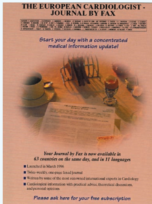
Abbildung 3: Die Ankündigung des EUROPEAN CARDIOLOGIST - Journal by Fax.

Nachfolgend möchten wir Sie gerne kurz über den organisatorischen Ablauf des Projekts informieren: